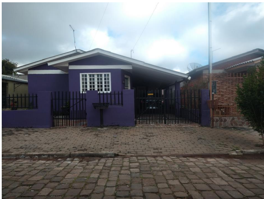
Edificação, conforme vistoria em 14 de agosto de 2023.