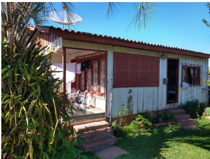
Edificação, conforme vistoria em 14 de agosto de 2023.