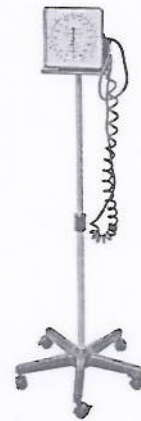
Esfingomanômetro hospitalar aneroide Mesa/parede/rodízio