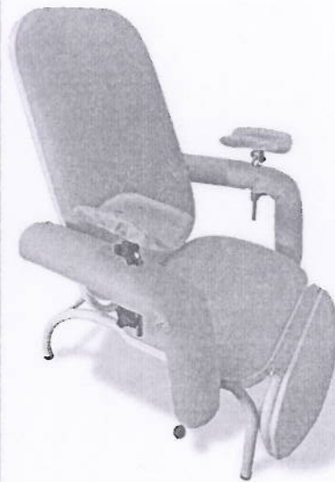
cadeira de coleta